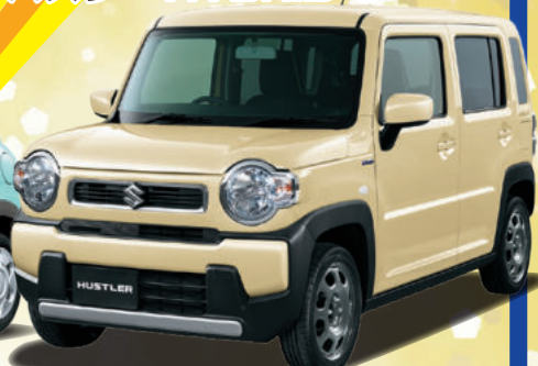
HUSTLER ハスラー HYBRID G