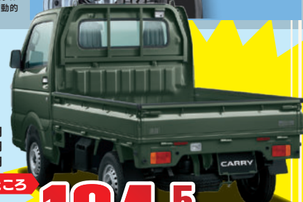
キャリイ 農繁スペシャル