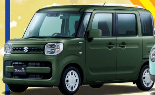
Spacia スペーシア HYBRID G