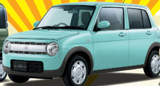
Lapin ラパン G