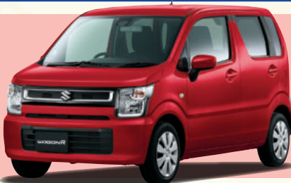
WAGON R ワゴンR FAスペシャル

WLTCモード 24.4 km/L 燃料消費率(国土交通省審査値)2WD-CVT車